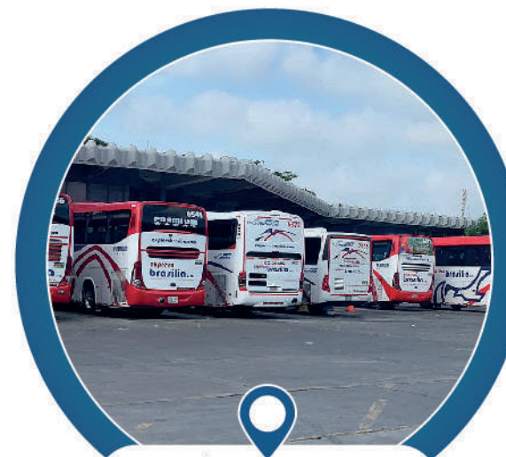
T. de transporte

Cerca del Portal de Transmetro y a 600 mts del Centro Comercial Nuestro Atlántico, a escasos minutos de la Avenida Murillo.