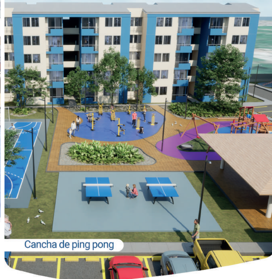
Cancha de ping pong