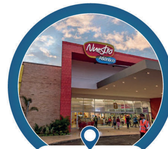
CC Nuestro Atlántico